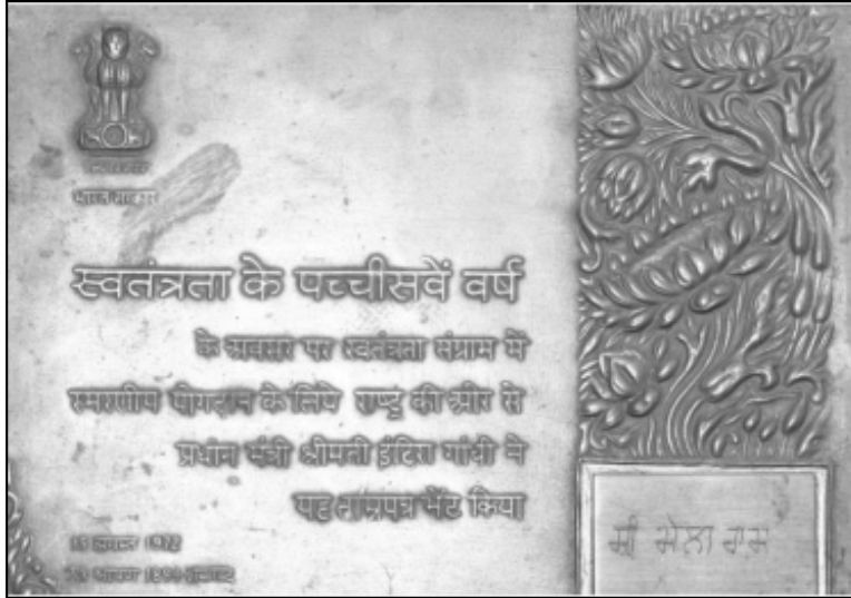
मेला राम ताइर नुं मिलिआ तामर पँतर