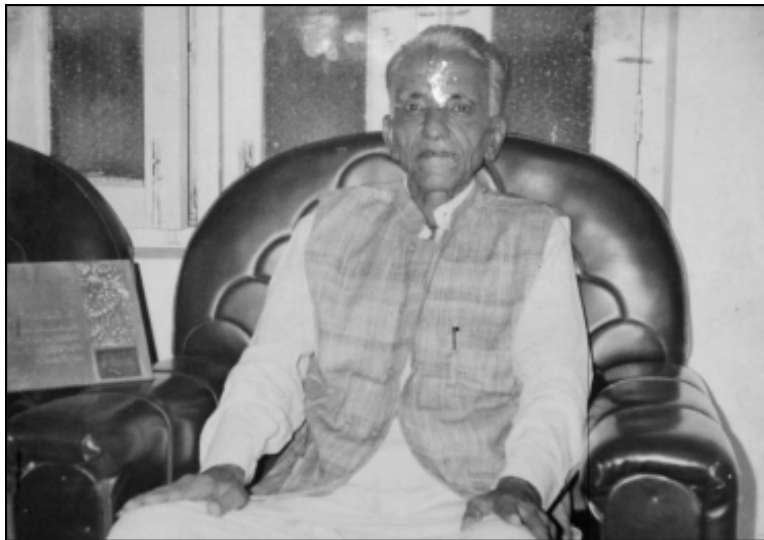
श्रीला राणी दा भरा किशन चंद