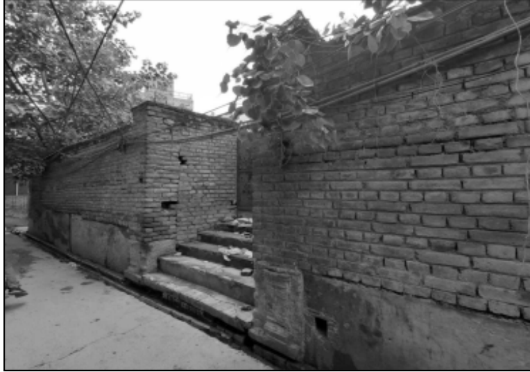
ਇਥੇ ਕਦੀ ਹੁੰਦਾ ਸੀ ਮੇਲਾ ਰਾਮ ਤਾਇਰ ਦਾ ਘਰ (ਜੁਲਕੀਆਂ ਮੁਹੱਲਾ, ਬਟਾਲਾ)